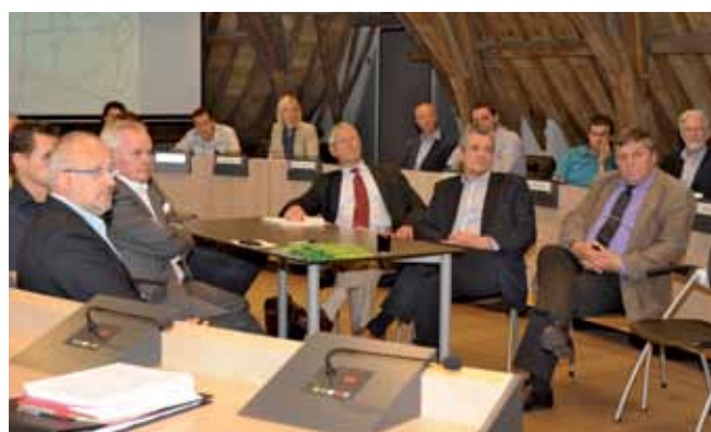
Ook burgemeesters uit de regio zetten hun schouders onder dit advies.

Een betere verkeersdoorstroming, maar ook de economische kwaliteit en vitaliteit van de regio wordt bepaald door de bereikbaarheid. Verkeerskundig adviesbureau Goudappel Coffeng en de Belgische partner Mint zullen zich de komende weken buigen over alle problematieken, die besproken zijn en een oplossing formuleren. Over zo'n anderhalve maand zullen de oplossingen uit de doeken gedaan worden.