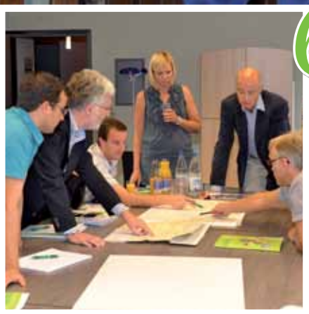
Werkgroepen voor ontsluiting Euregio