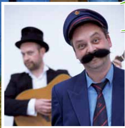
Programmatie CC De Breughel