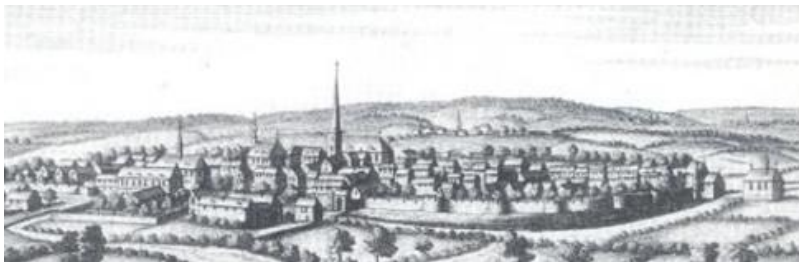
Zicht op de stad Bree, ets van R. Leloup uit 1745.

Aan de kerk staat een zuil die symbool staat voor de stedelijke vrijheden in het prinsbisdom Luik en het feit dat Bree één van de 22 “Goede Steden” van het Prinsbisdom was. Het is dus ook een herinnering aan het eeuwigdurend verbond tussen de 22 Goede Steden van het Prinsbisdom Luik gesloten tijdens de Sint-Denijsnacht op 3 oktober 1386. Het perron werd in 1986 teruggeplaatst naar aanleiding van de feestelijkheden rond 600 jaar perronrechten. De zuil wordt bekroond door een pijnappel en een kruis, de prinsbisschoppelijke symbolen.